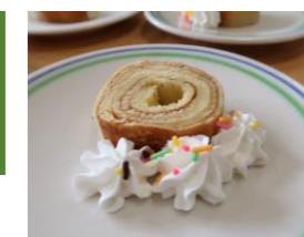
手作りバウムクーヘン

ドリンクは約10種類のメニューから選べます。お菓子は毎回違うものをご用意しています。 調理レク、手作りおやつ、選べるお菓子、ドリップコーヒー等のイベントがあります。