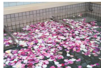
バラの花びら風呂